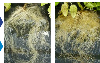
Control Kiplant VS-04